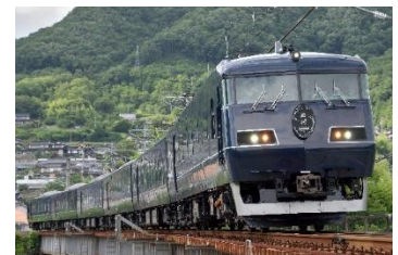
「WEST EXPRESS 銀河」

このたび、JR 西日本グループの関係会社が連携し、観光列車「WEST EXPRESS 銀河」をオマージュした家具の販売を開始します。これらオマージュ家具は、日ごろから鉄道車両の部品を製作している匠の手により完成したものです。鉄道を普段の生活の一部としてご利用いただく、という JR 西日本グループの新しい挑戦にぜひご期待ください。