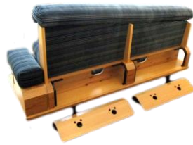
キャットトンネル